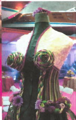
ROBE J. P. GAULTIER INSIGNE DE BRONZE