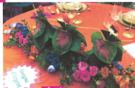
DÎNER INSIGNE D'ARGENT