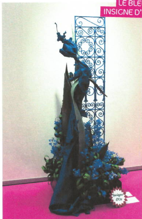
LE BLEU INSIGNE D'OR